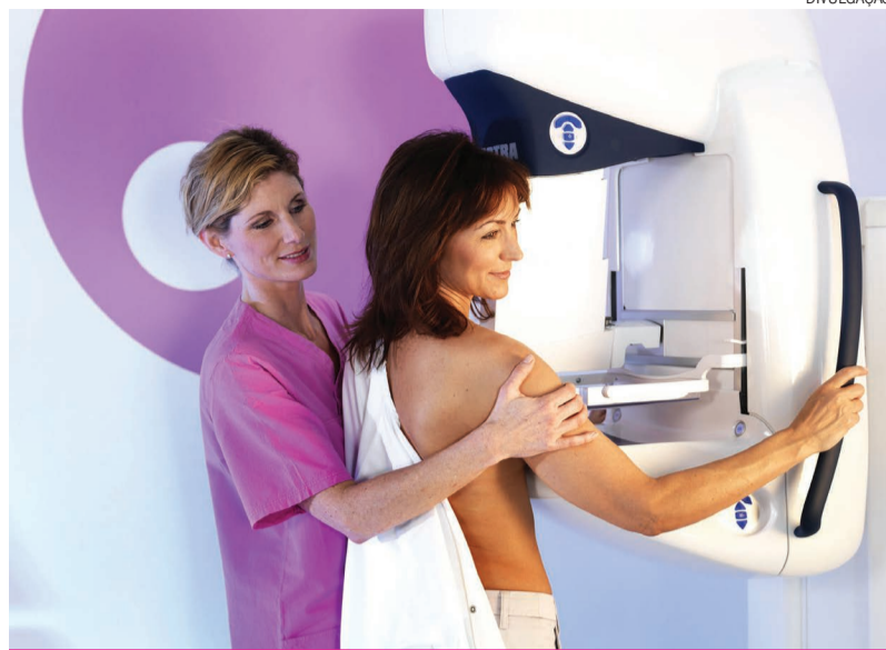
Além do autoexame, a mamografia e o ultrassom são de extrema importância para a identificação do câncer de mama

O diagnóstico deste tipo de câncer passa por várias etapas, mas o princípio de tudo é através do autoexame. “Mais importante ainda é a mamografia e o ultrassom, onde é levantado uma suspeita de alteração na mama. A partir daí é feita uma biópsia e se confirmado o tumor, a pessoa