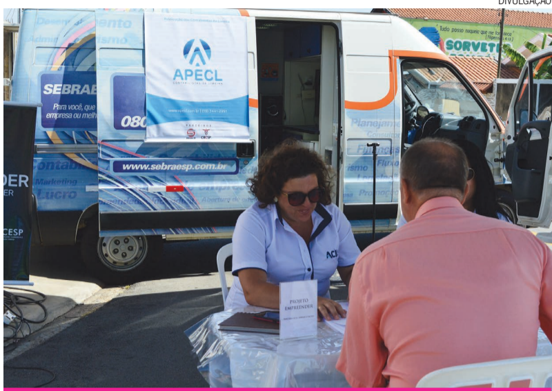
Os empresários puderam tirar as dúvidas sobre a ACIL e também em relação à abertura e formalização do seu negócio

Mais uma edição do ACIL Itinerante foi promovida em Limeira. A ação aconteceu no dia 29 de setembro, na região do Parque Hipólito. O projeto leva a Associação para mais perto do empresário e mantém a sua disposição representantes dos departamentos da associação, da cooperativa de crédito Sicoob Acicred, o Sebrae Móvel e um consultor contábil indicado pela Associação dos Contabilistas