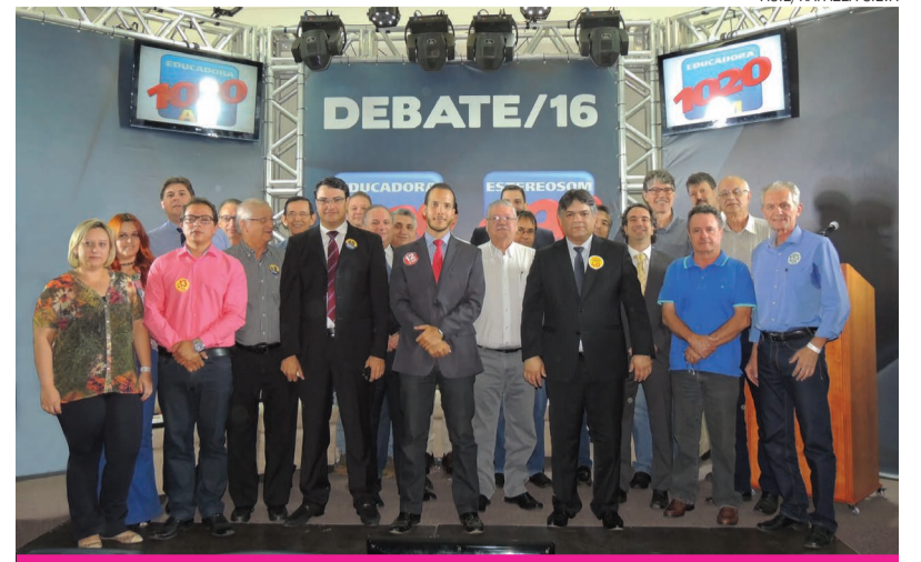
Candidatos a prefeito de Limeira e diretoria da ACIL

Nas ocasiões os candidatos tiveram a oportunidade de se ques-